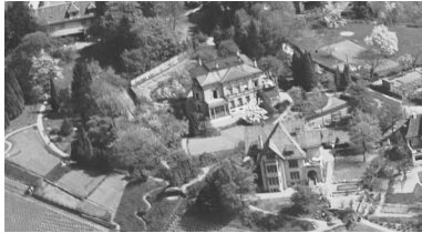
Ausschnitt aus einem Luftbild, Schrägaufnahme, 2.5.1944