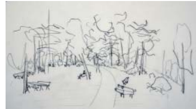
Bündelpflanzung mit Stilleichen, Eingang Bruderholzwald