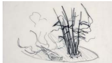
Sitzplatz Flughafenblick, Käferbergwald in Zürich