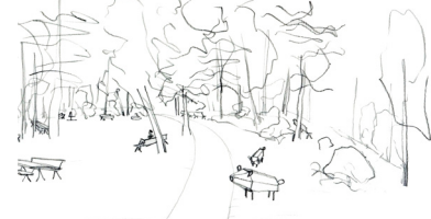
Bündelpflanzung mit Stileichen, Eingang Bruderholzwald