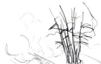
Sitzplatz Flughafenblick, Käferbergwald in Zürich