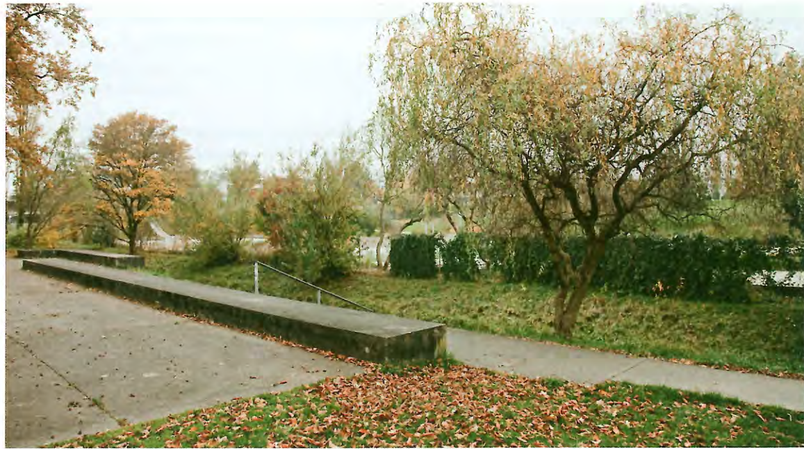
Centre sportif de loisirs de Seebach, réalisé par l'architecte-paysagiste Willi Neukom, 1963–1970

A PARAÎTRE: GUIDE «LES JARDINS PATRIMONIAUX DANS LA PLANIFICATION»