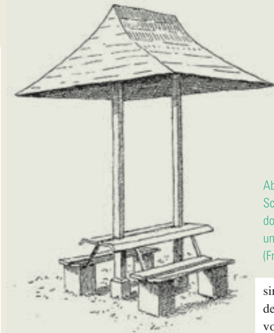
Abb. 5: Bank mit Schirmdach aus Theodor Felbers Buch Natur und Kunst im Walde (Frauenfeld 1906).