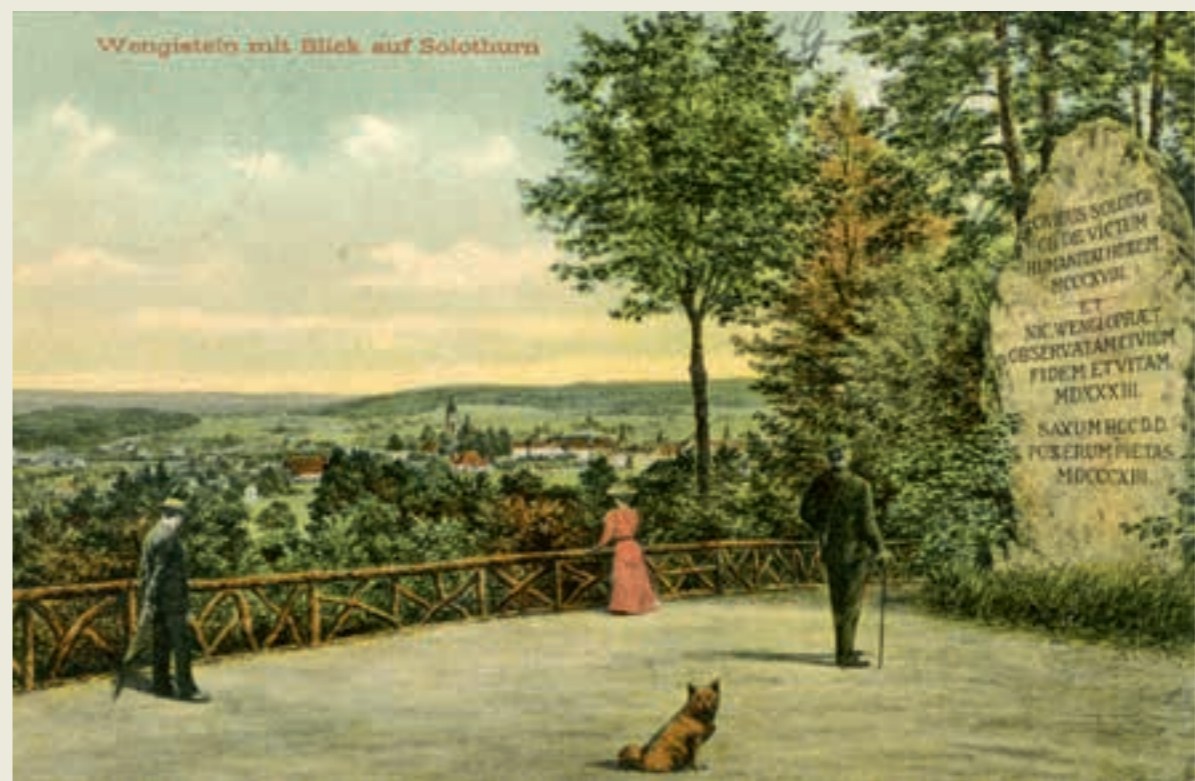
Abb. 3: Der Wengistein auf dem Känzeli mit Blick auf Solothurn, Postkarte 1908.