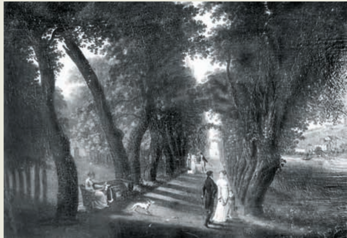
Abb. 2: Promenade im Platzspitz in Zürich, um 1815. Ölbild von Johann Caspar Rahn (1769–1840).